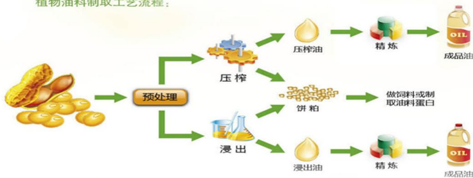
植物油料制取工艺流程：

食用植物油的好，不能单单只看外观是否清澈，颜色清淡，更要关注营养伴随物含量和危害物的多少。食用植物油的营养伴随物（包括甾醇总量及组成、生育酚及生育三烯酚、角鲨烯、多酚、谷维素、芝麻素等营养成分）与人体健康的关系十分密切，不同品种的油脂中营养伴随物的种类和含量差别较大。我国实施“优质粮食工程”首次在《中国好粮油 食用植物油》标准中设置植物油营养伴随物为标签标识的指标，引导植物油加工最大化的保留营养功能性成分，为消费者提供不同类型营养成分的健康产品，让消费者根据自身状况明明白白选择食用油，避免营养功能性物质长期摄入过低造成的健康隐患。